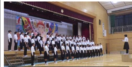
♪この地球のどこかで（2学年）