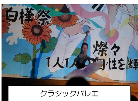
クラシックバレエ