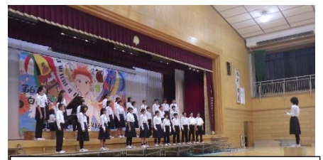
♪旅立ちの時~Asian Dream Song~（2の1）