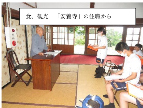
食、観光 「安養寺」の住職から