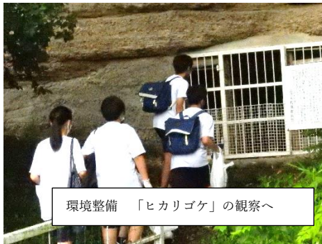
環境整備 「ヒカリゴケ」の観察へ