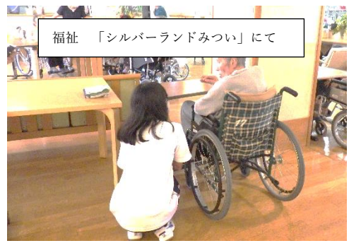
福祉 「シルバーランドみつい」にて