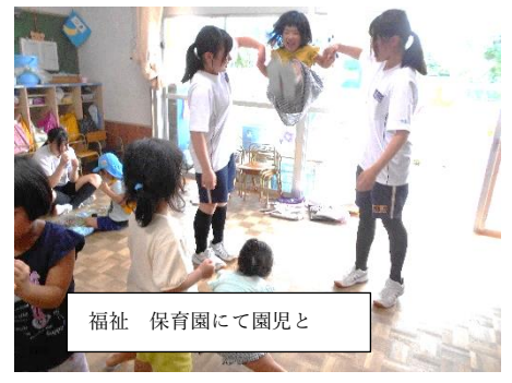
福祉 保育園にて園児と