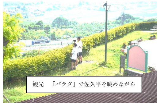
観光 「バラダ」で佐久平を眺めながら