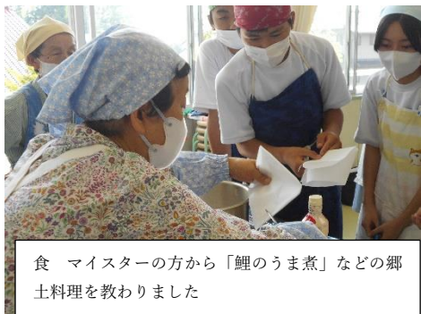
食 マイスターの方から「鯉のうま煮」などの郷土料理を教わりました