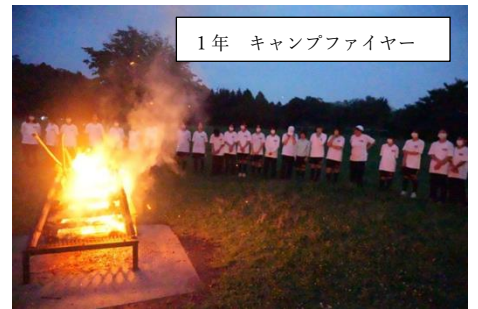
1年 キャンプファイヤー

あすからは、長い夏休みになります。先輩から引き継いだ部活動を、新体制のもと厳しい練習に励む1, 2年生も多いことでしょう。3年生は、2学期にある生徒会最大行事である「白樺祭」の準備、そして受験にむけて猛勉強を行う人も少なくないと思います。忙しい人もいますが、忙しい活動を充実感に変えて頑張ってください。また、何かをするときに、意見がぶつかるときもあるかもしれませんが、相手をおもいやり対話することでよりよい方向を見いだしてください。そして、怪我や事故のない、たのしい夏休みにしてください。8月27日に、皆さんが笑顔で登校して来るのを楽しみにしています。