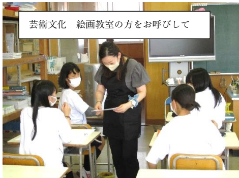
芸術文化 絵画教室の方をお呼びして