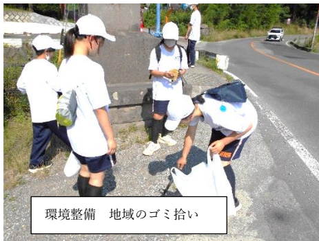
環境整備 地域のゴミ拾い