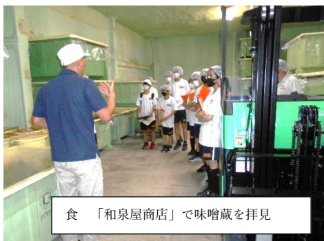
食 「和泉屋商店」で味噌蔵を拝見