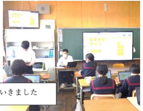
いろいろな方法でグループの意見をまとめていきました