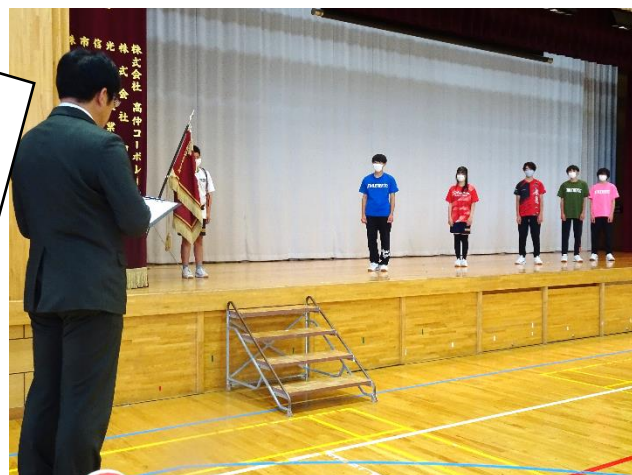
<7/1, 2の陸上県大会に向けての壮行会>