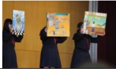
左：部活動説明会（4月） 各部が工夫をこらして、1年生に入部をPRしました。