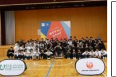
左：あすチャレ・スクール（5月） 3年生が、シドニーパラリンピック男子車いすバスケット日本代表キャプテン根木慎志さんと、車いすバスケットを通して、交流を深めました。