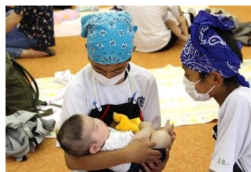
赤ちゃんふれあい体験