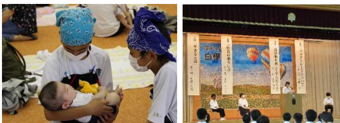
赤ちゃんふれあい体験