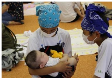
赤ちゃんふれあい体験